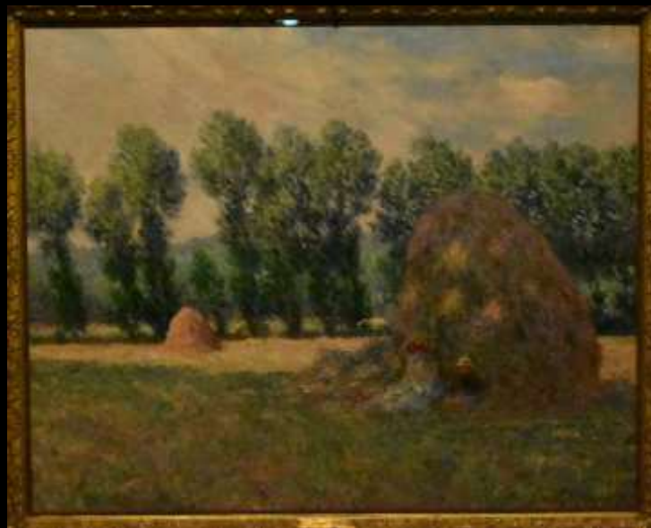
La meule de foin