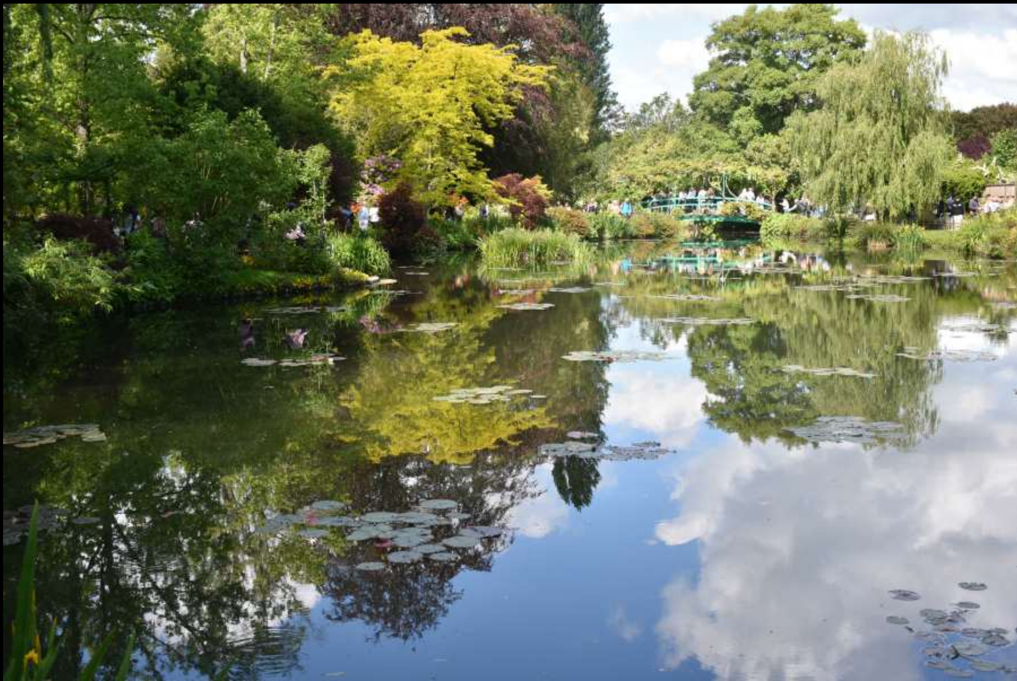
Visite aux étangs de la propriété, pour lesquels Monnet avait détourné un ruisseau. 12/05/2026