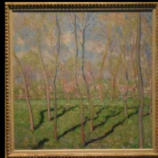
Arbres en hiver, vers Bennecourt