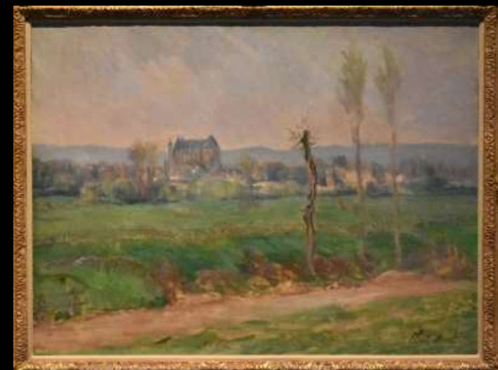
Panorama de Vernon