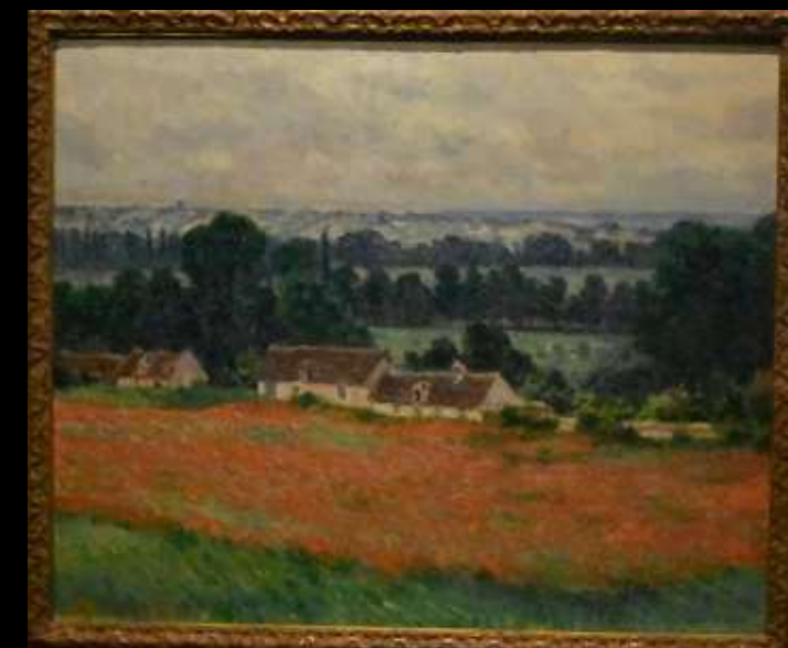
Champs de coquelicots à Giverny