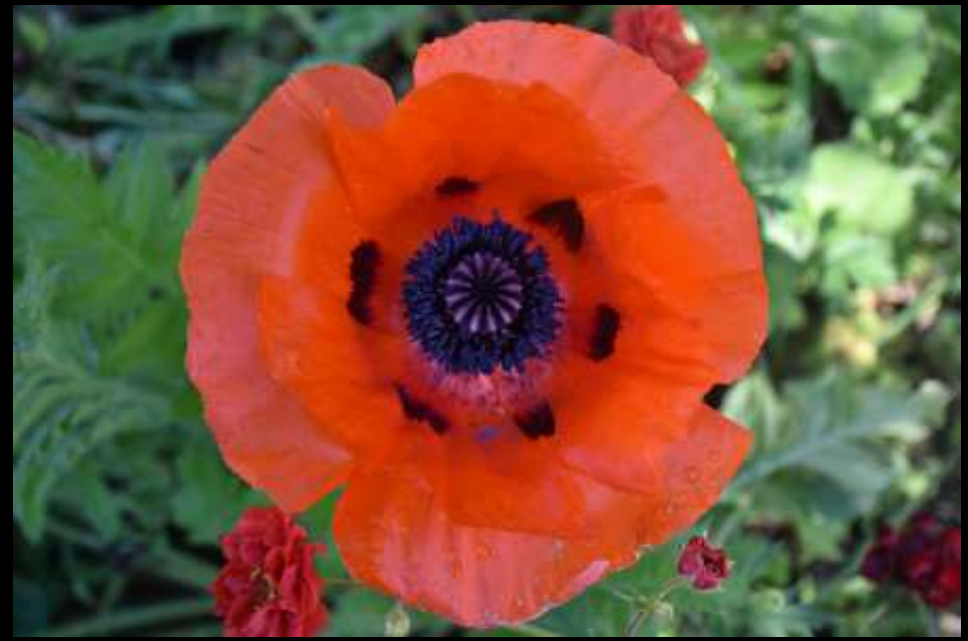
Les pavots côtoient le lupin.