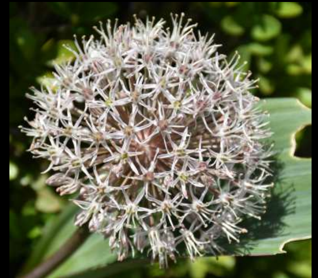
Jeux de feuillages et fleurs originales (quoique).