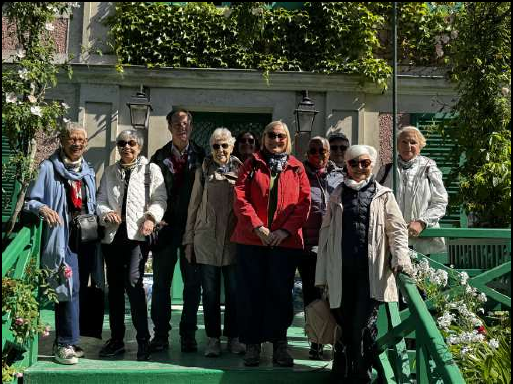
Le groupe souriant des visiteurs.