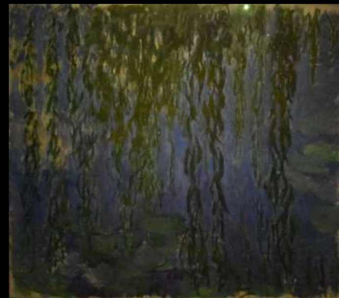
Nymphéas avec rameaux de saule